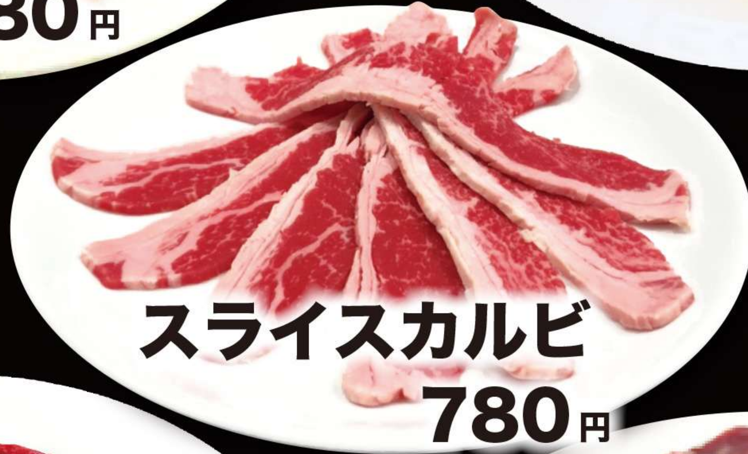
スライスカルビ 780円