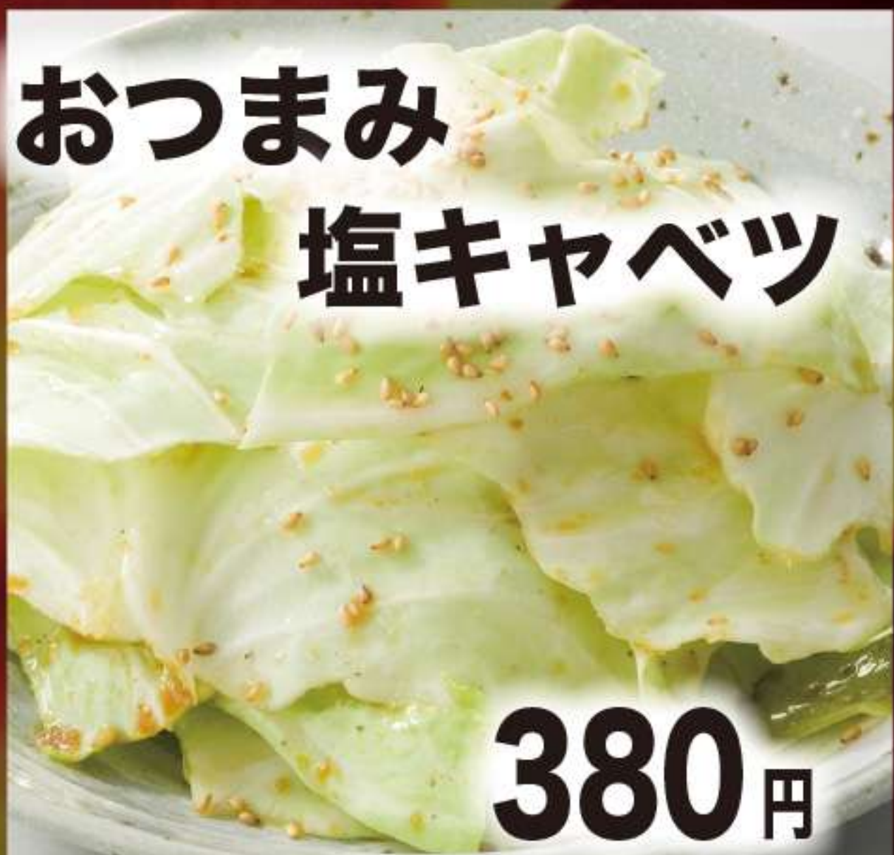
おつまみ 塩キャベツ 380円