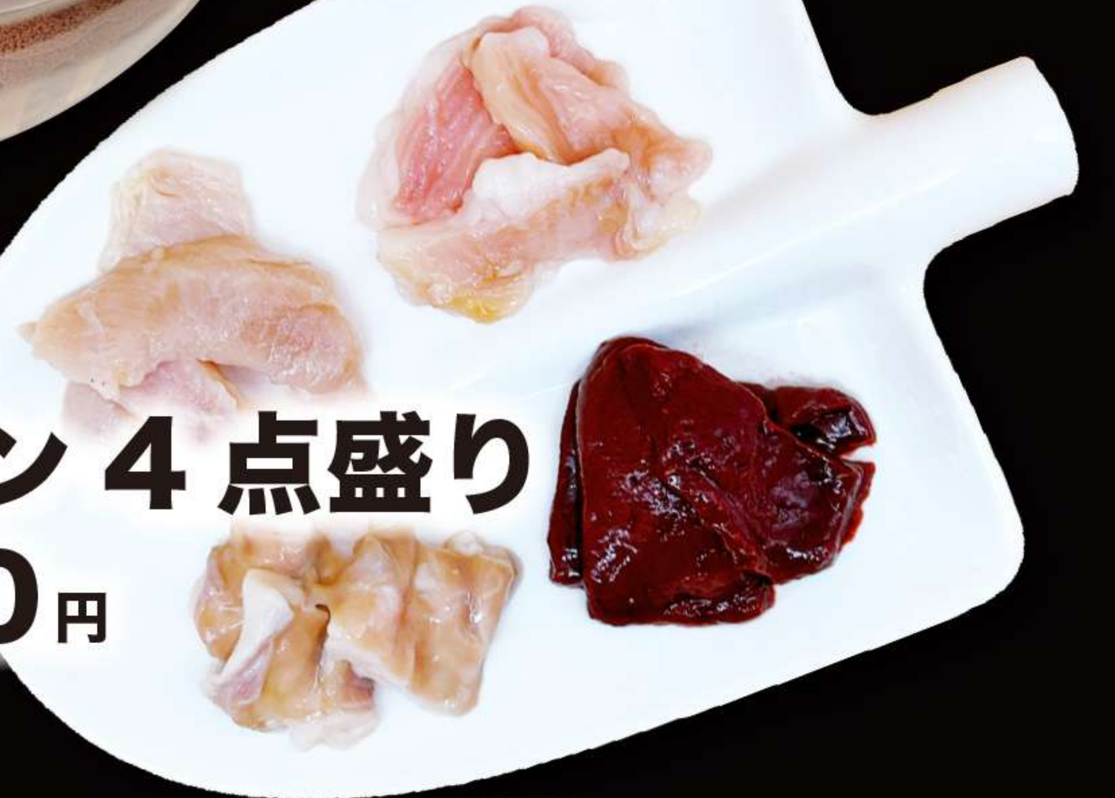
牛ホルモン4点盛り 1680円