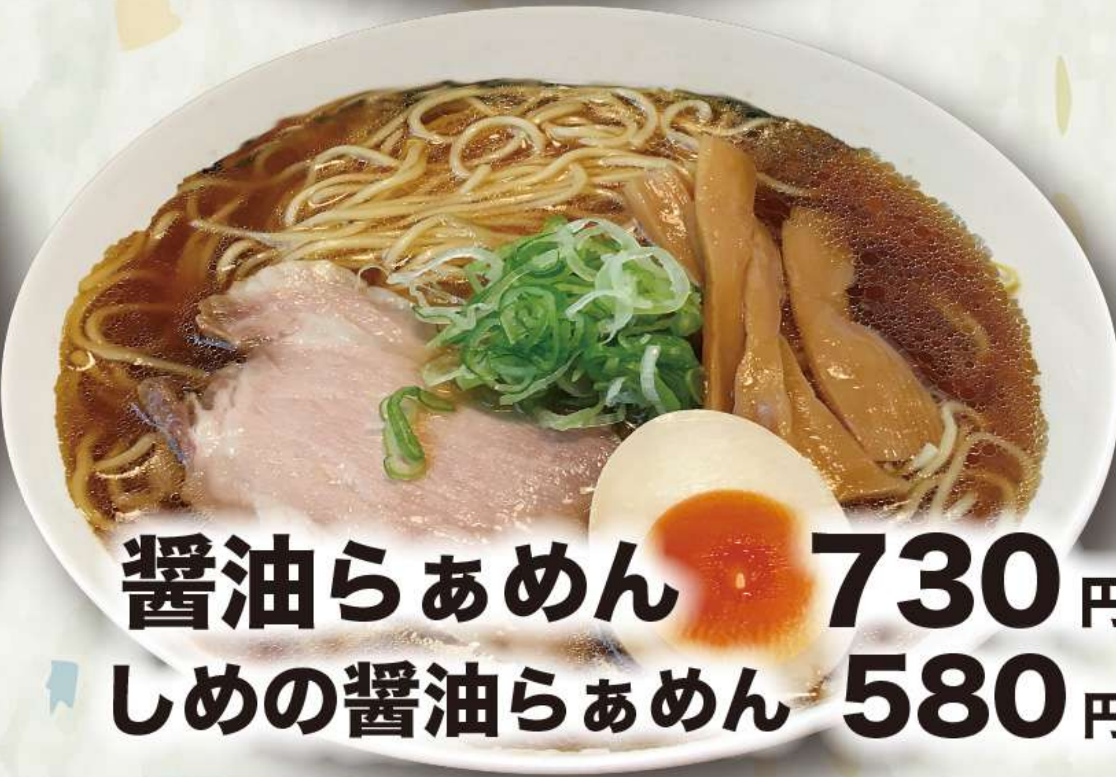
醤油らあめん 730円 しめの醤油らあめん 580円