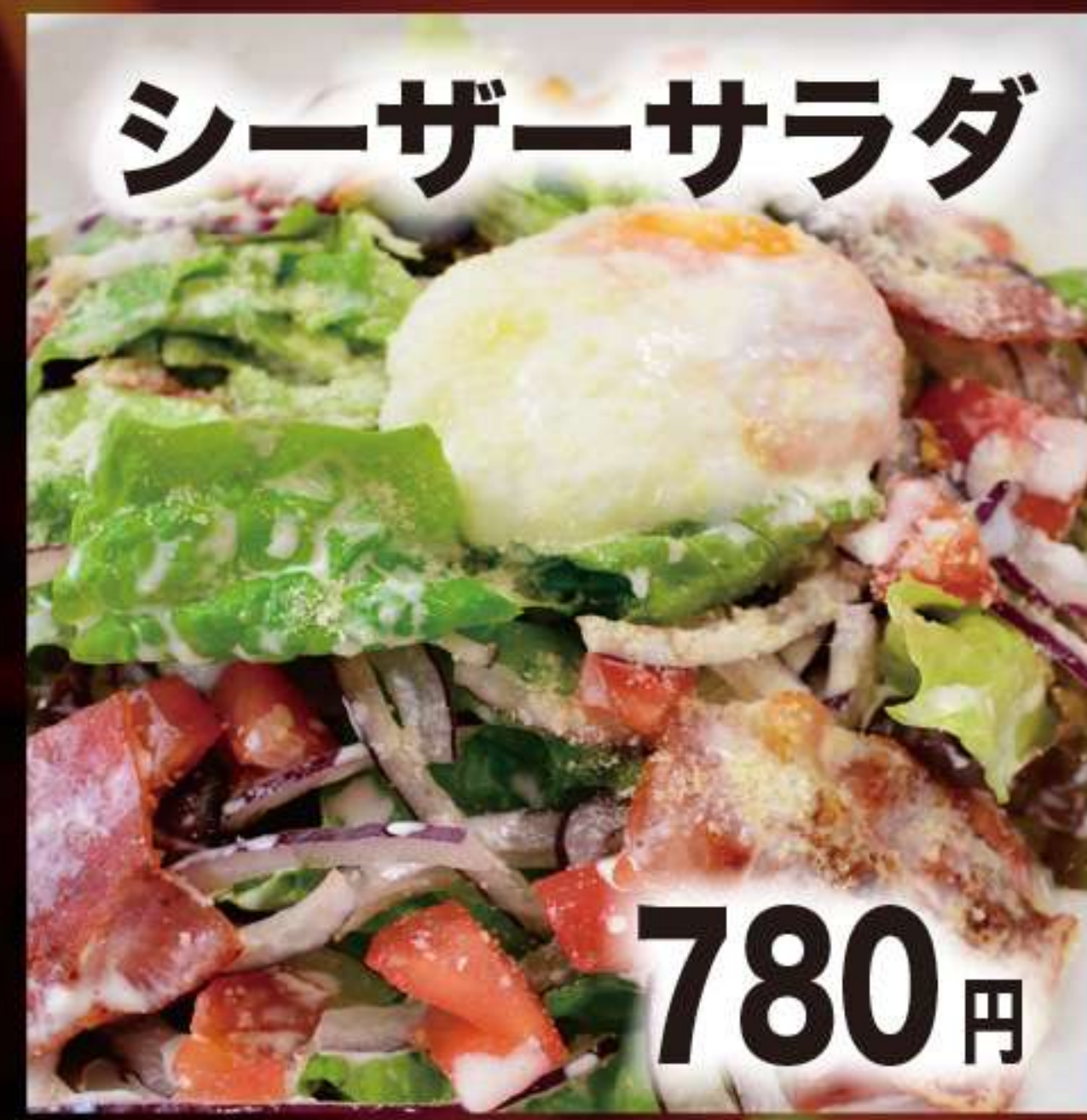
シーザーサラダ 780円