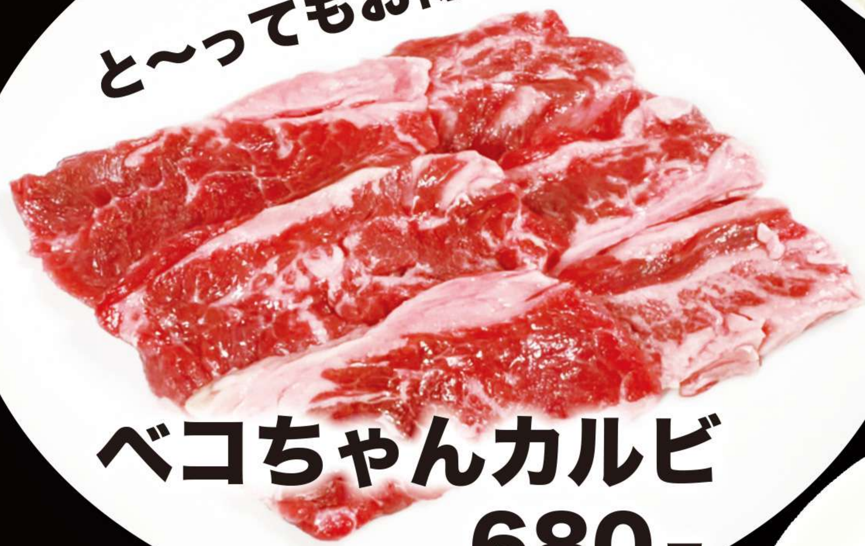
ベコちゃんカルビ 680円