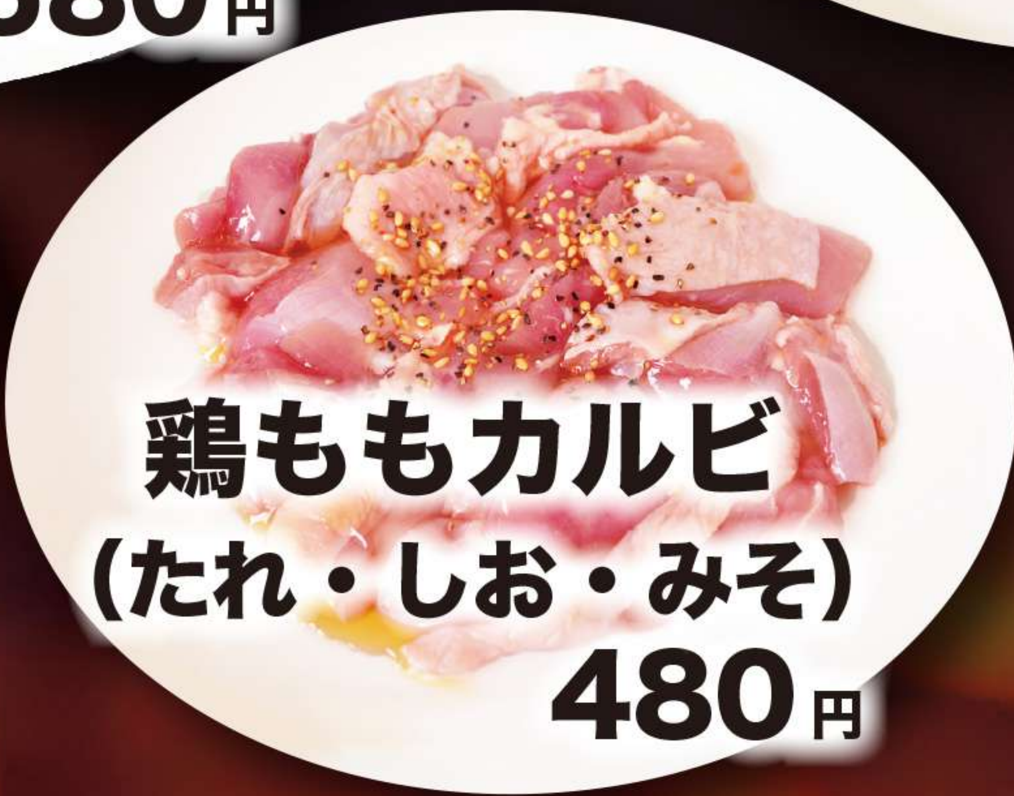
鶏ももカルビ (たれ・しお・みそ) 480円