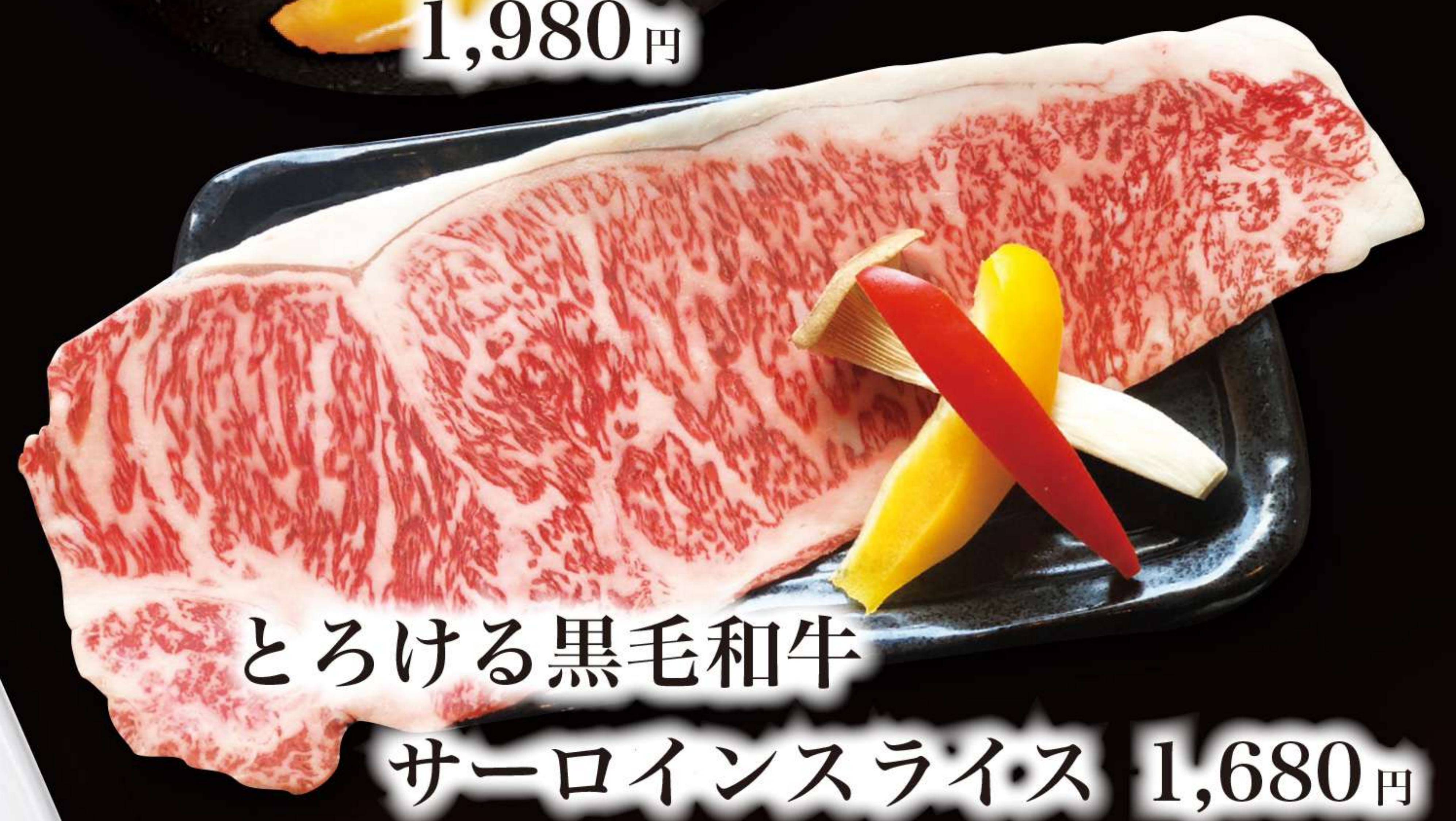
とろける黒毛和牛 サーロインスライス 1,680円