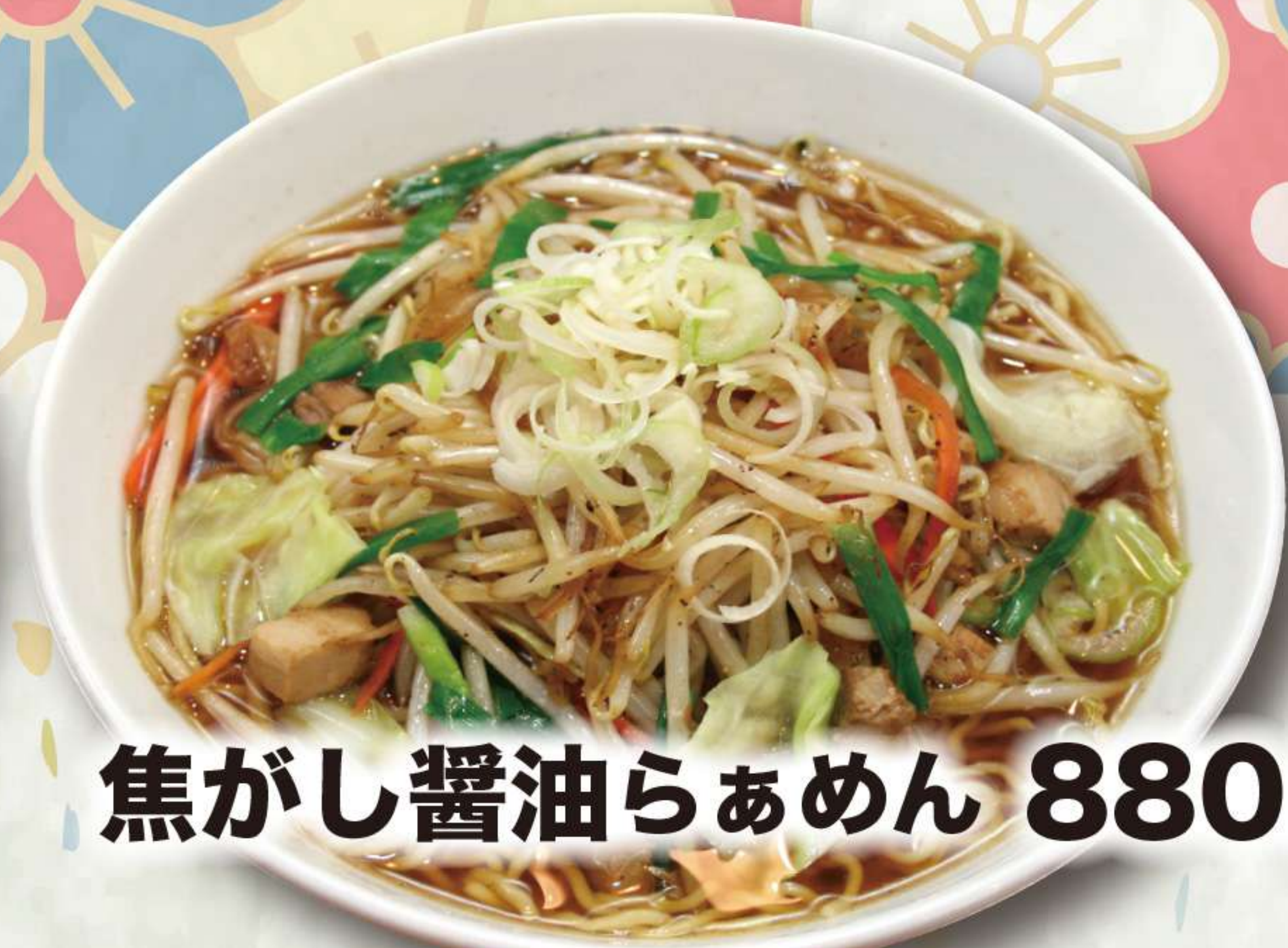
焦がし醤油らあめん 880円