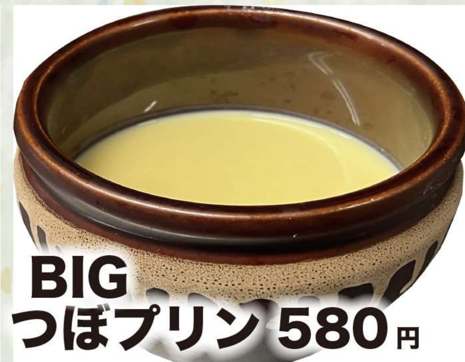
BIG つぼプリン 580円