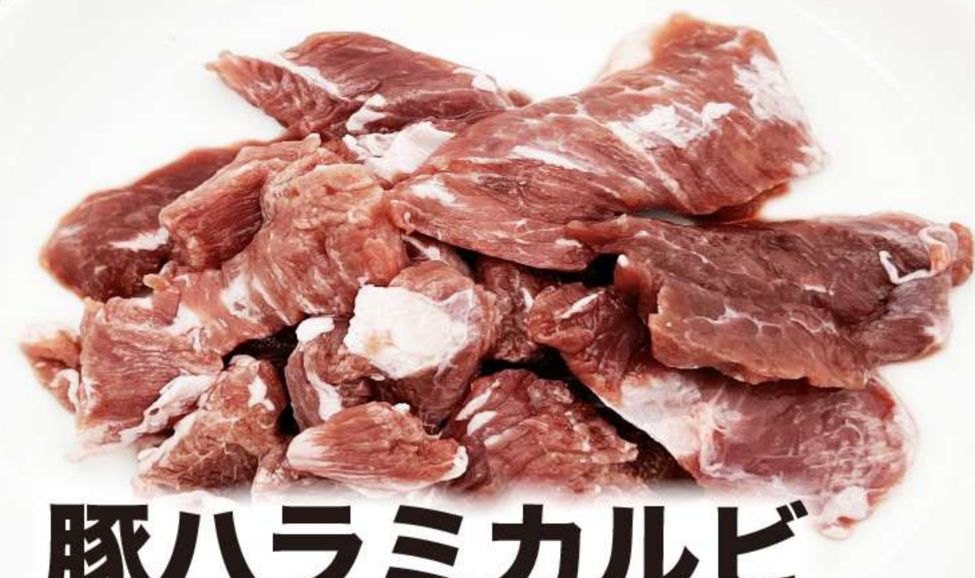
豚ハラミカルビ (たれ・しお) 580円