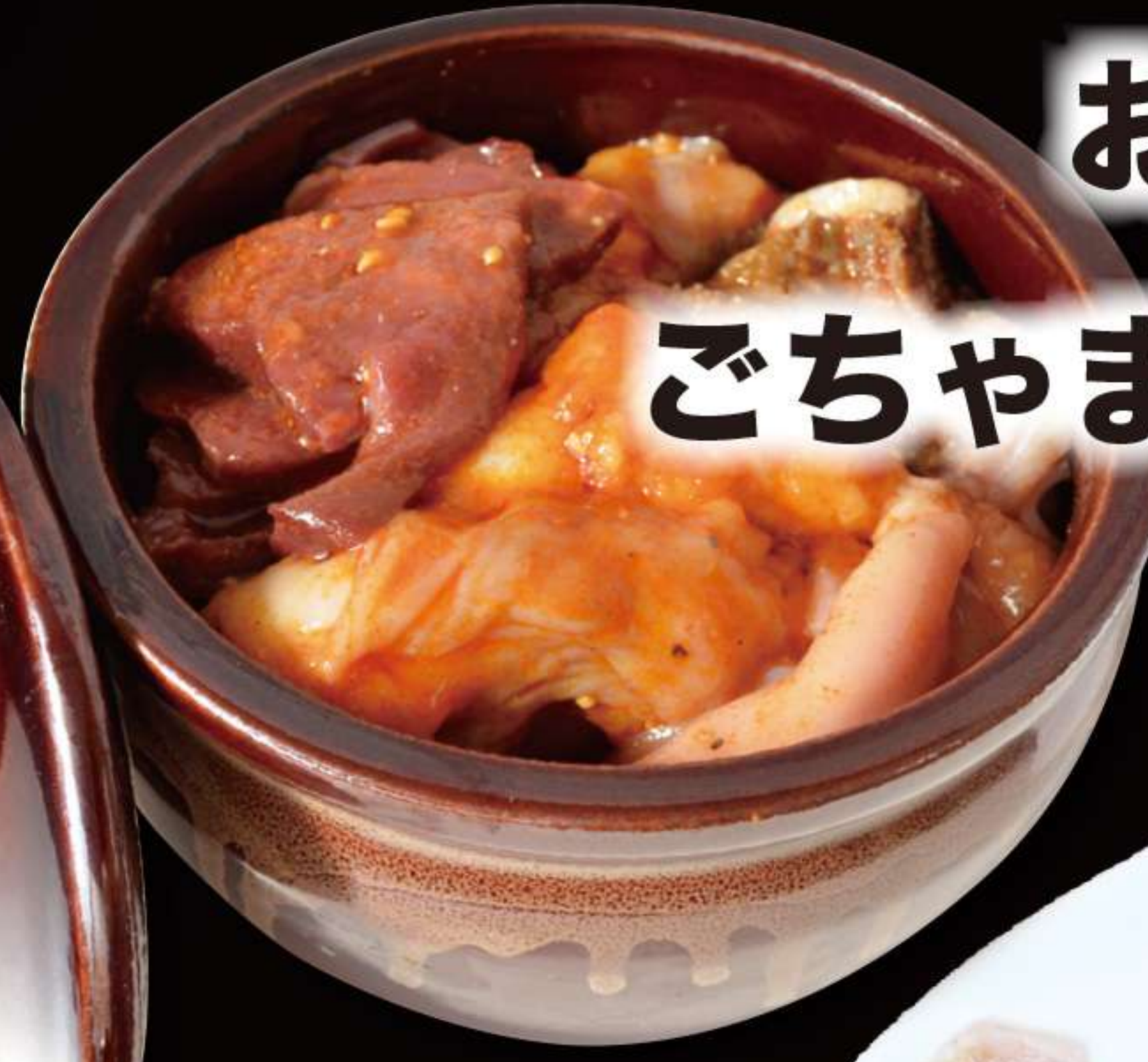
お得！壺漬け ごちゃませホルモン 1780円