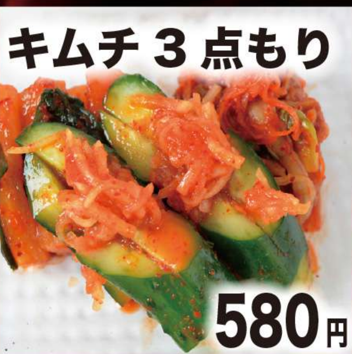
キムチ 3点もり 580円