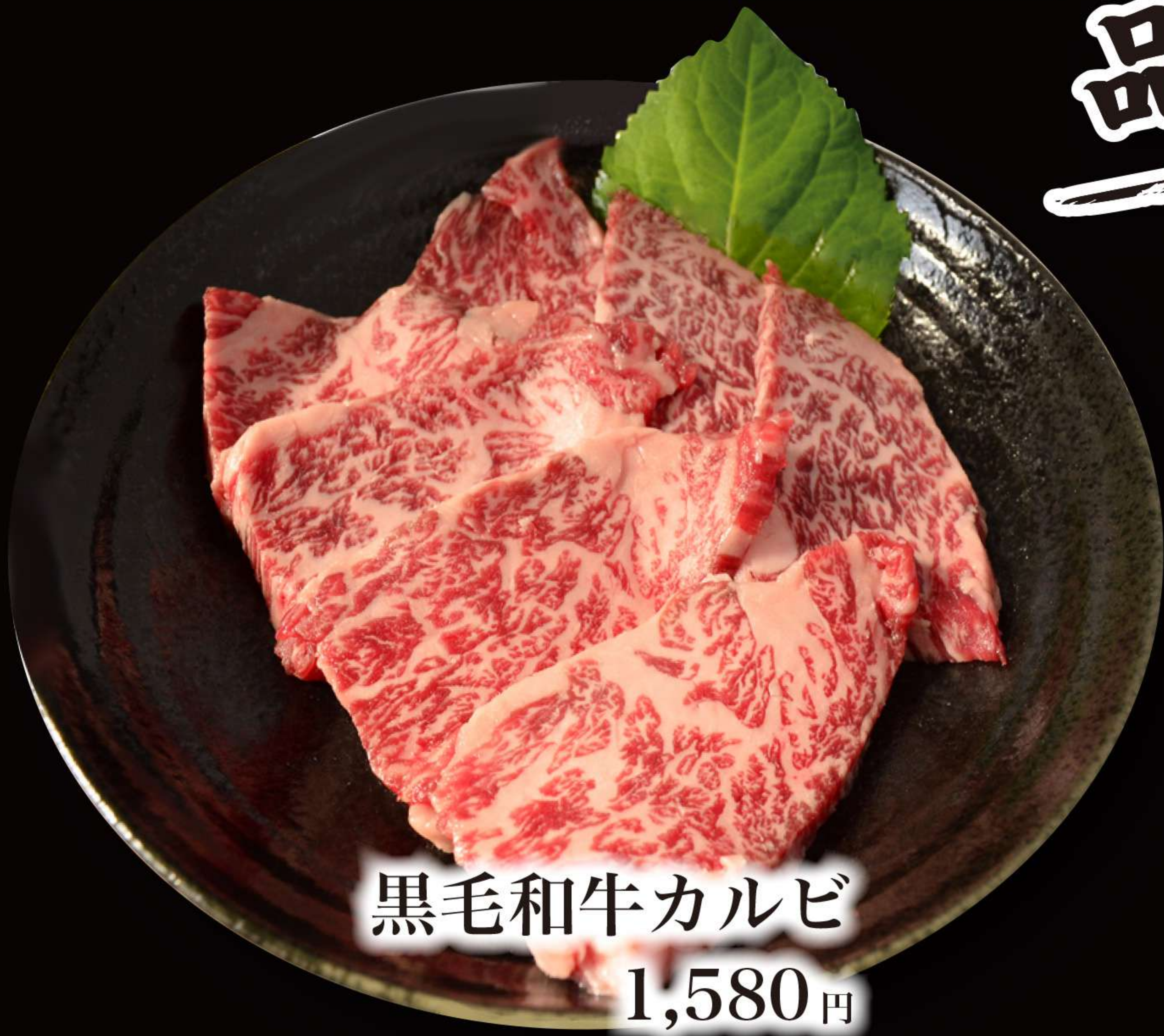
黒毛和牛カルビ 1,580円