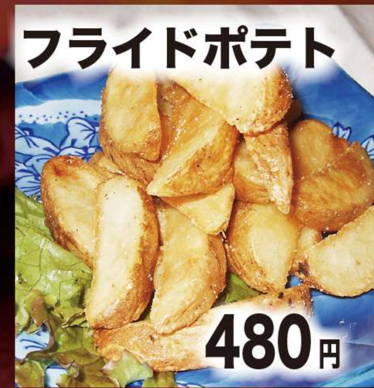
フライドポテト 480円