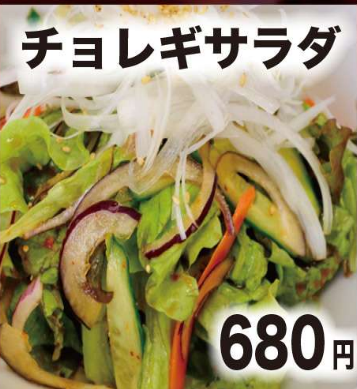
チョレギサラダ 680円