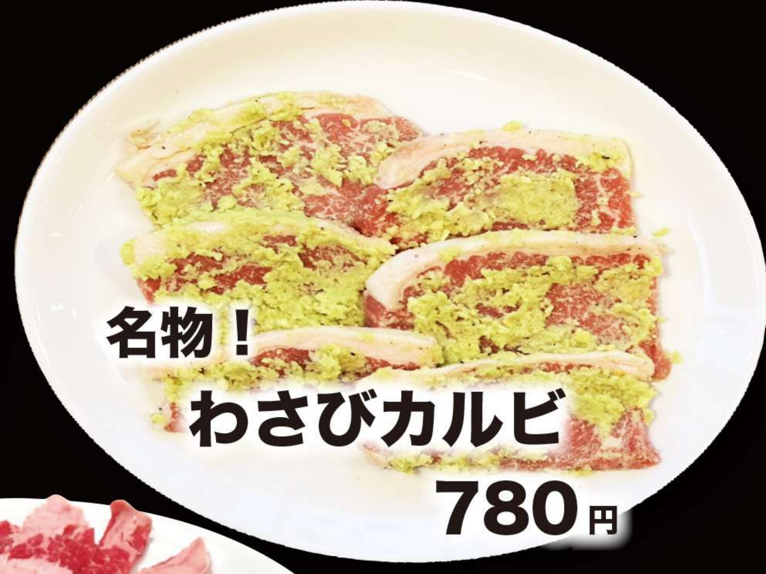
名物! わさびカルビ 780円