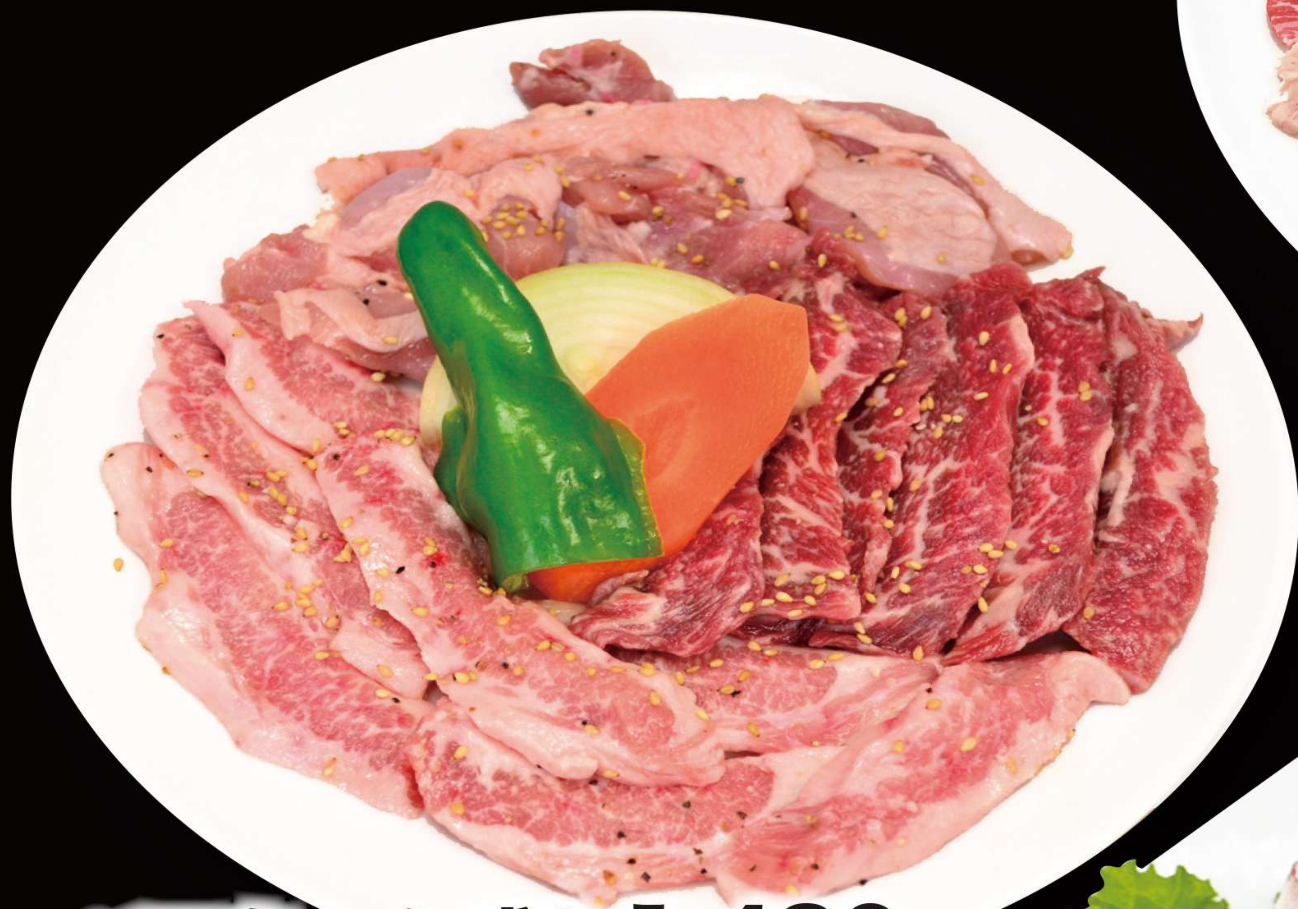
ベコちゃん盛り 1,480円