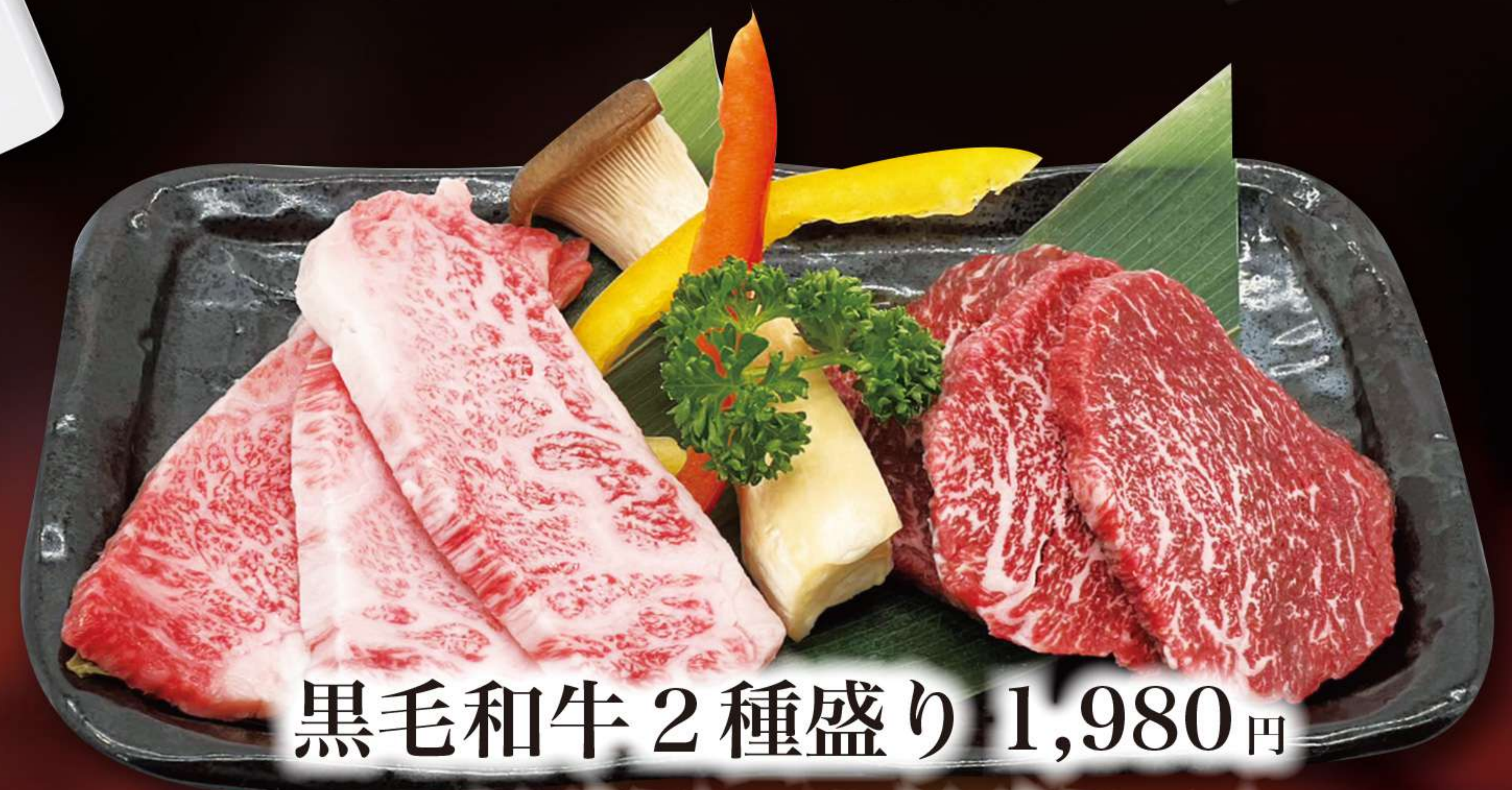
黒毛和牛2種盛り 1,980円