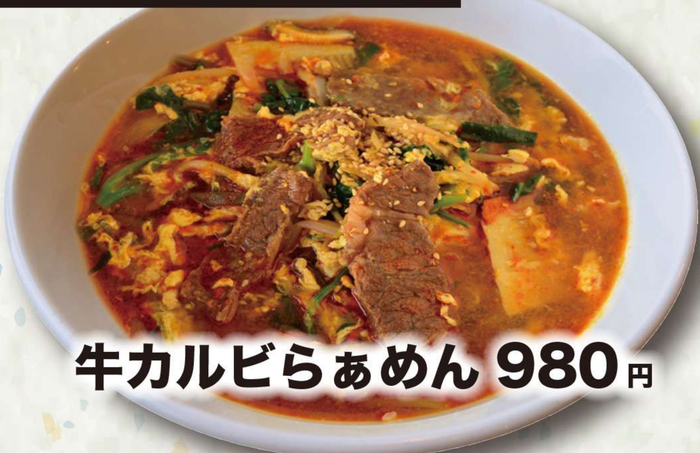
牛カルビらあめん 980円