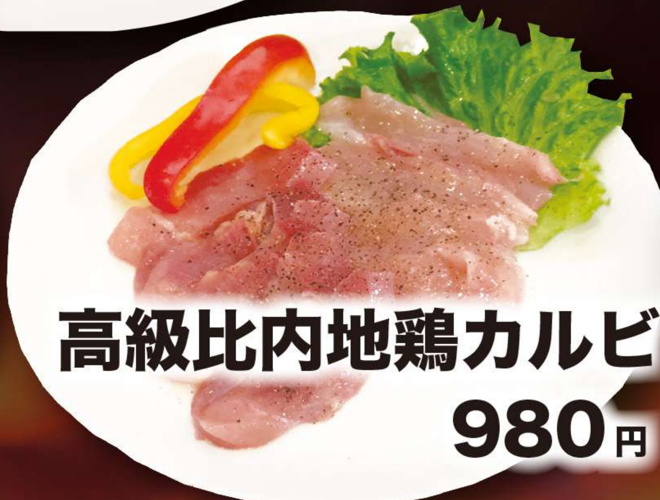
高級比内地鶏カルビ 980円