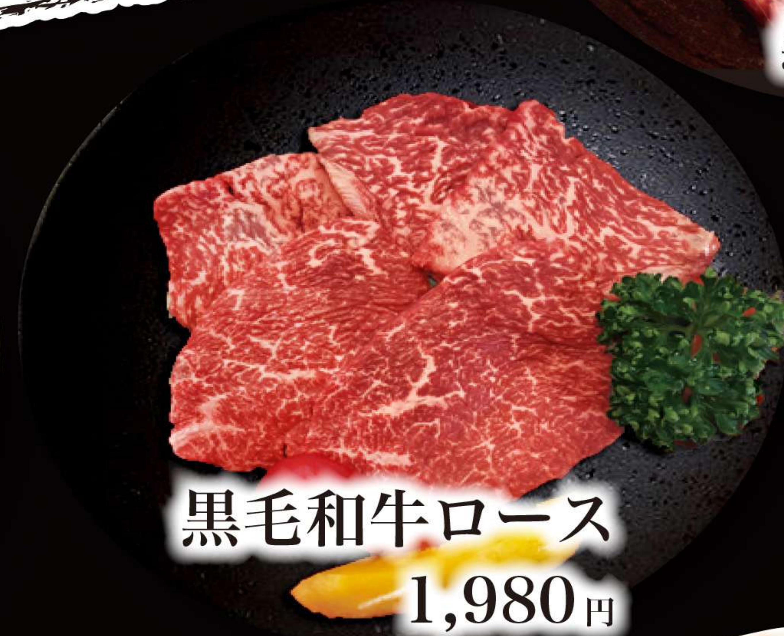
黒毛和牛ロース 1,980円