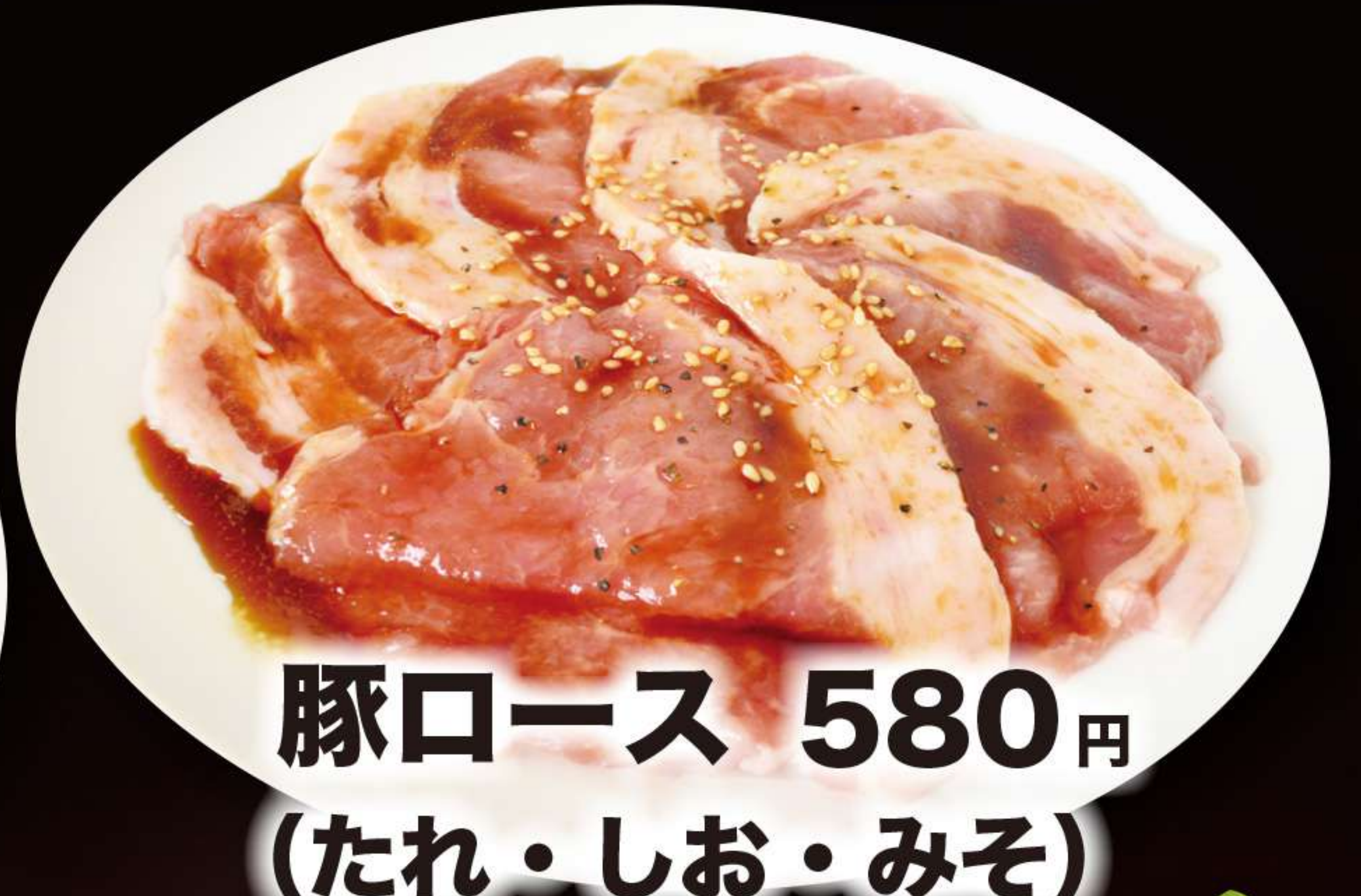
豚ロース 580円 (たれ・しお・みそ)