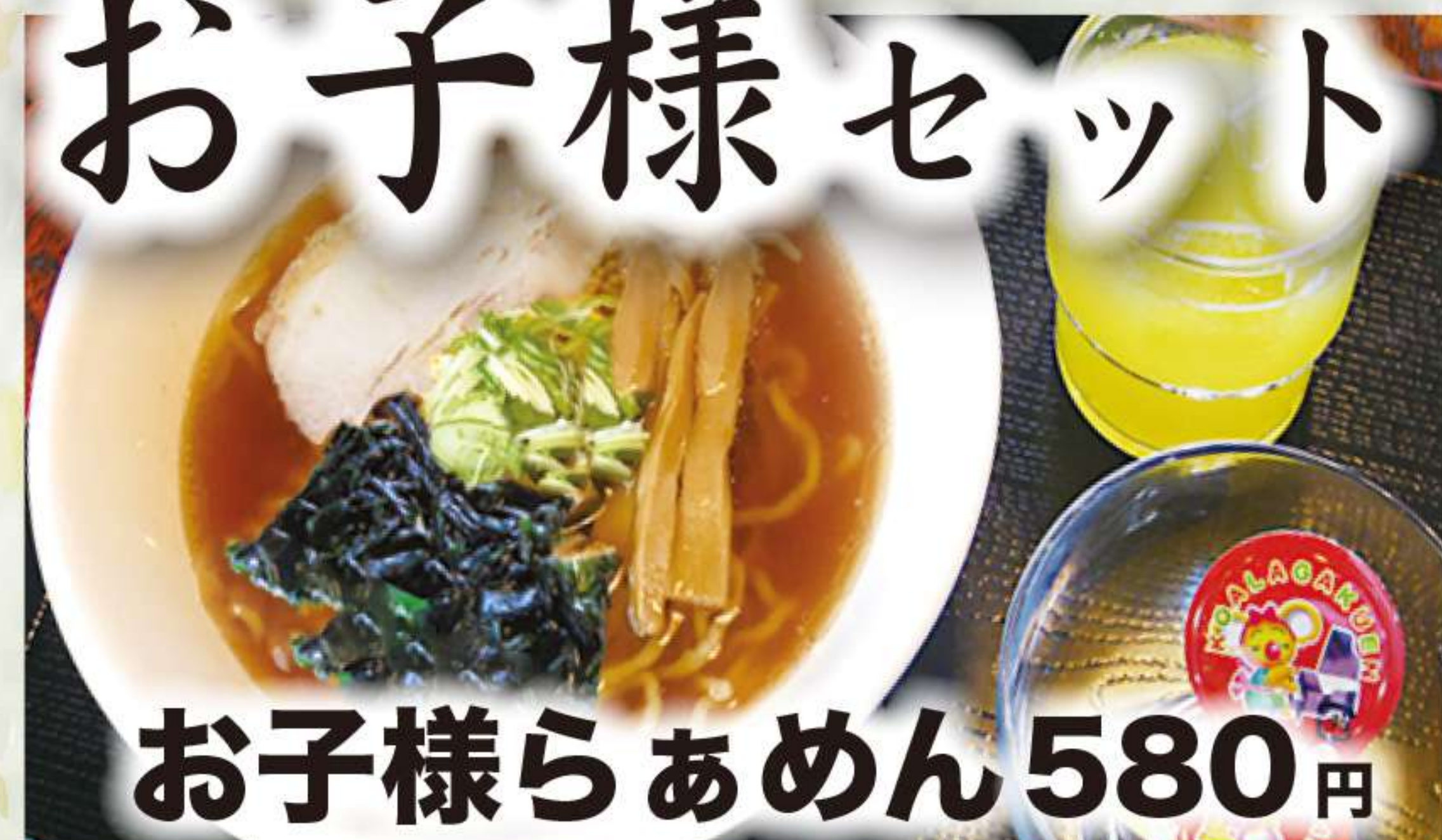
お子様らあめん 580円