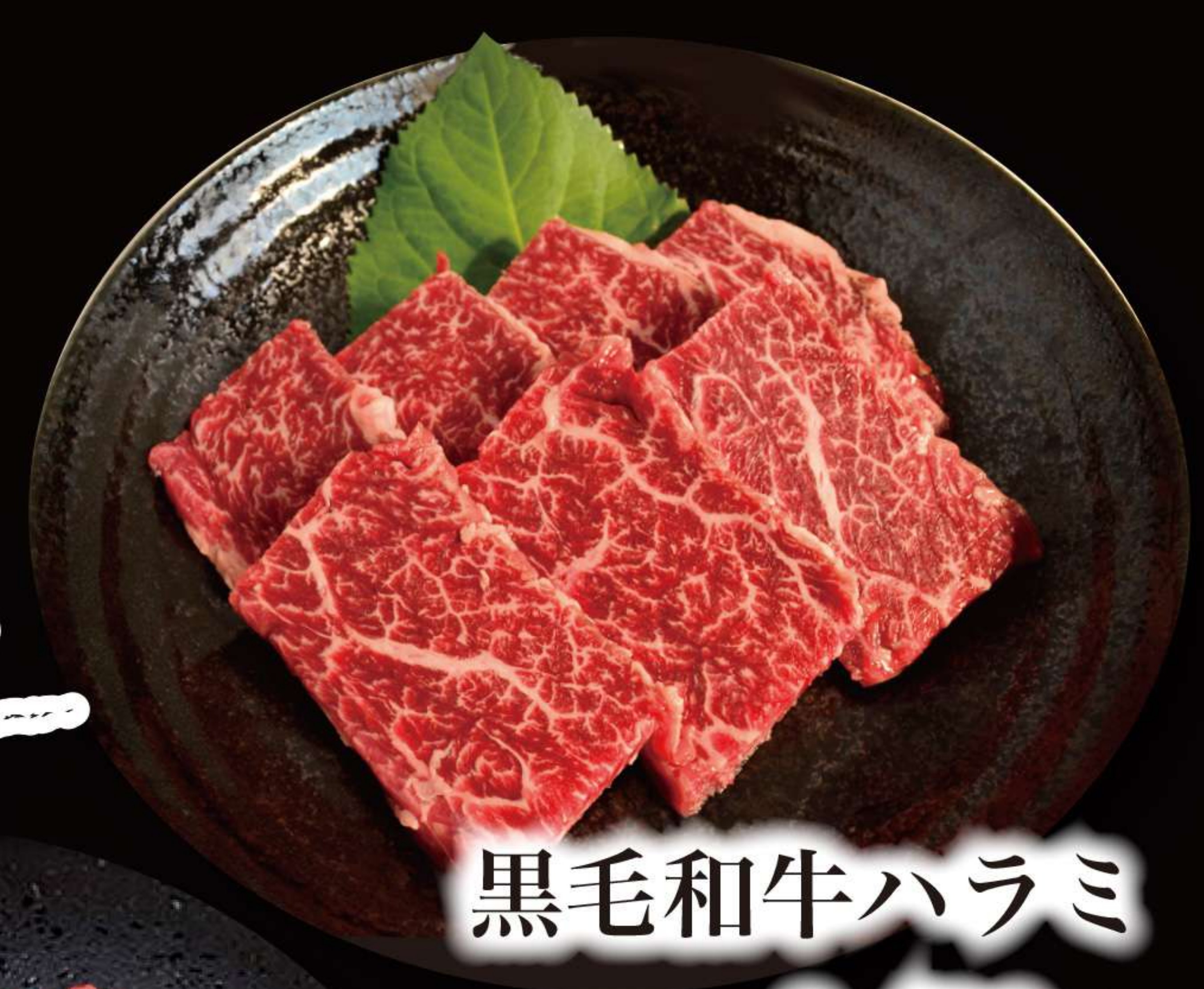
黒毛和牛ハラミ 2,480円