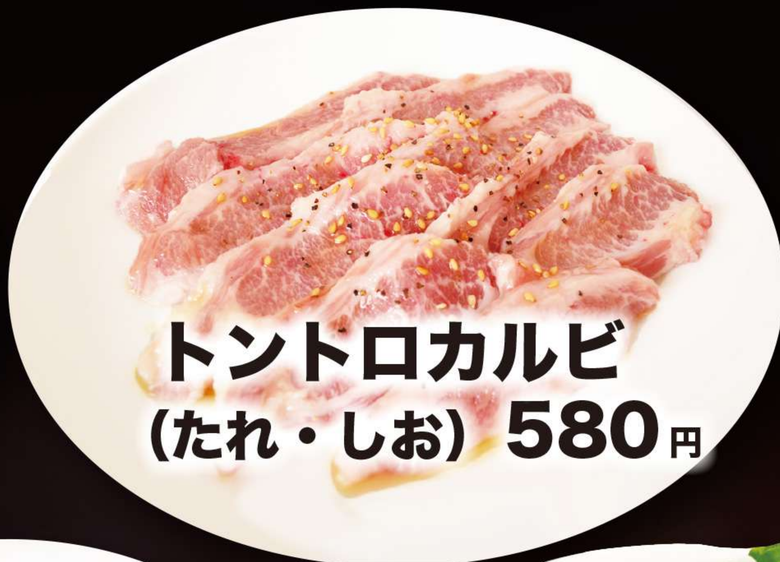
トントロカルビ (たれ・しお) 580円