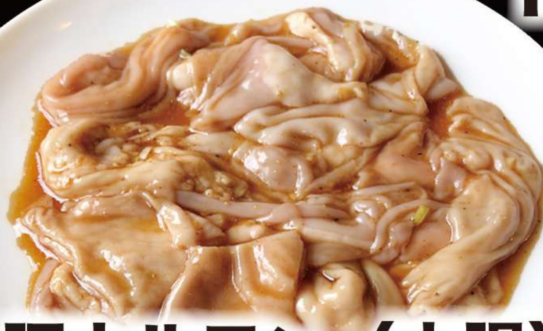
豚ホルモン(小腸) 480円