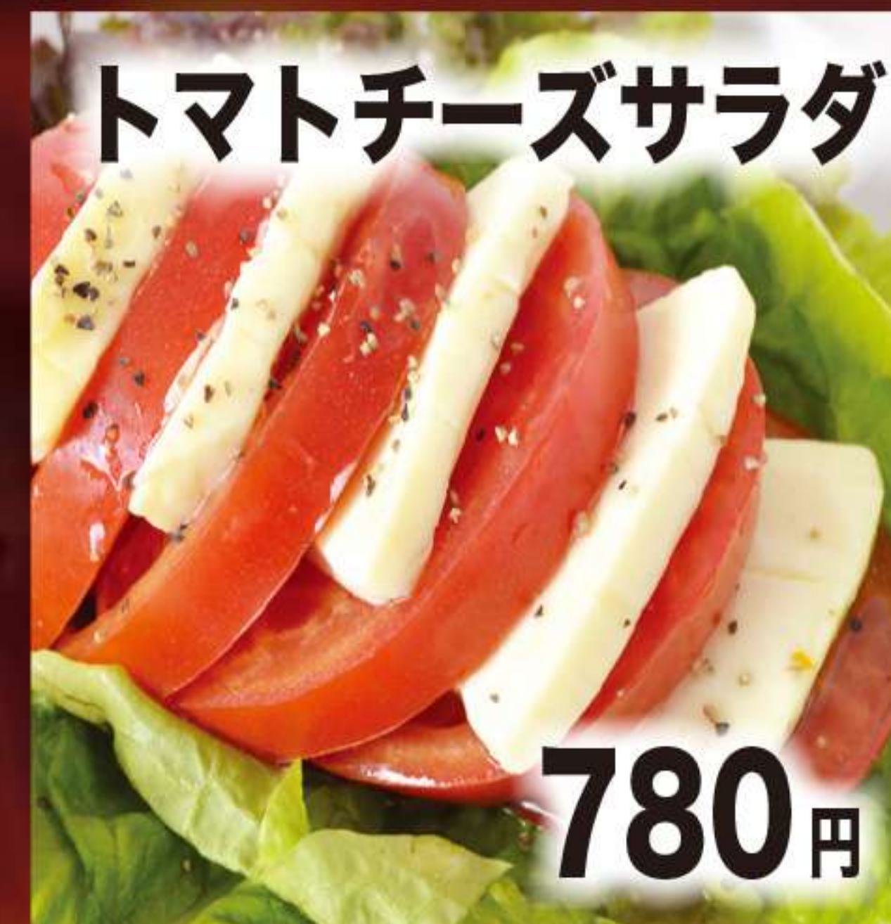
トマトチーズサラダ 780円