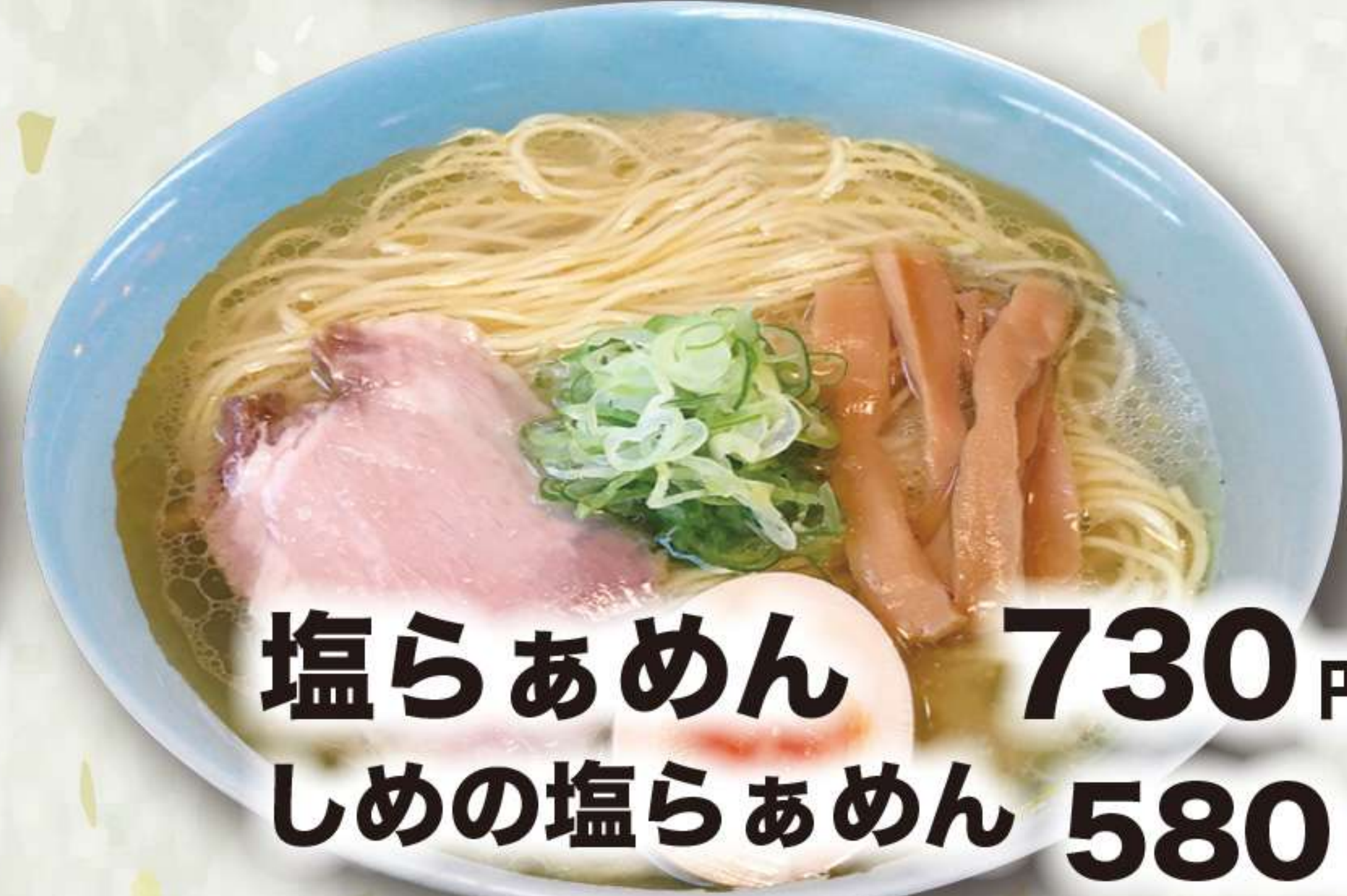
塩らあめん 730円 しめの塩らあめん 580円