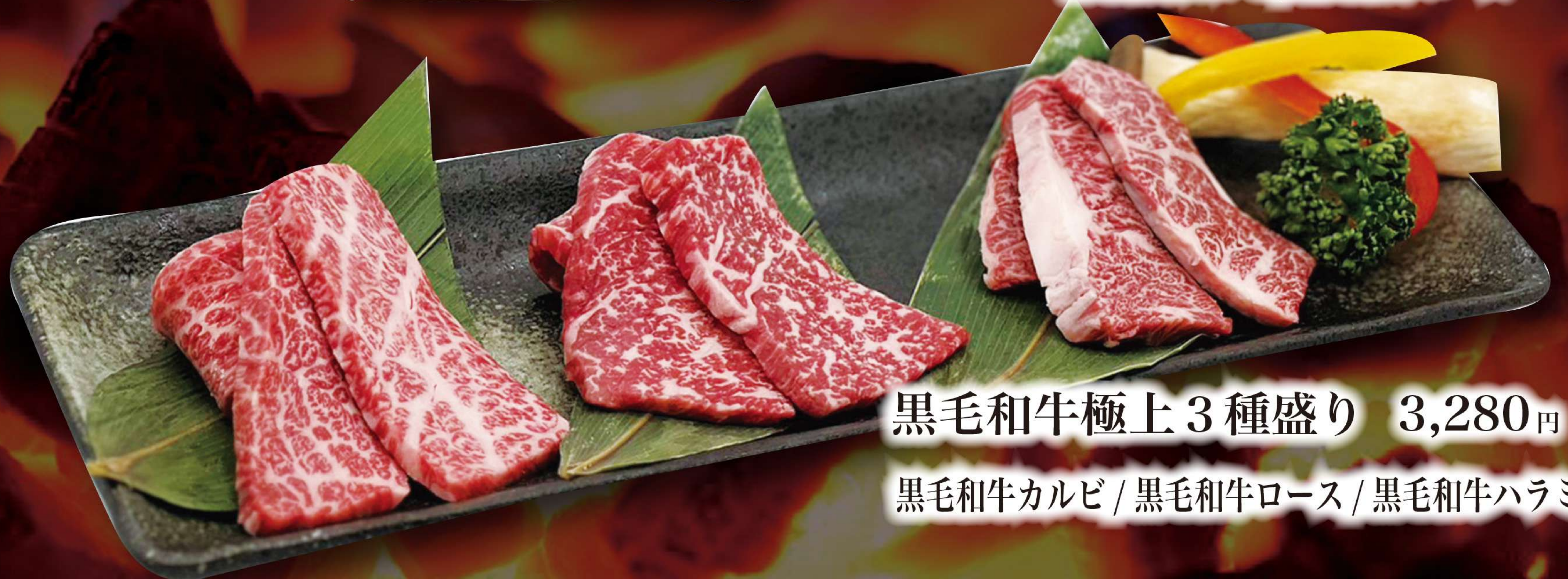
黒毛和牛極上3種盛り 3,280円