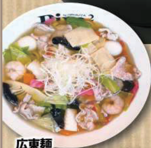
広東麺 980円 (税抜 891円)