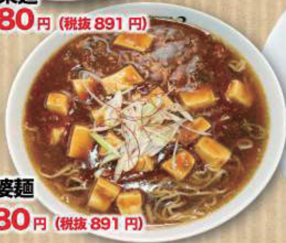
麻婆麺 980円 (税抜 891円)