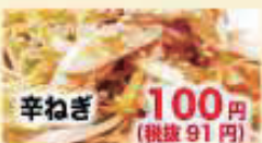
辛ねぎ 100円 (税抜 91円)