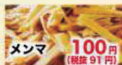
メンマ 100円 (税抜 91円)