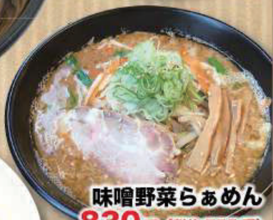
味噌野菜らあめん 830円 (税抜 755円)