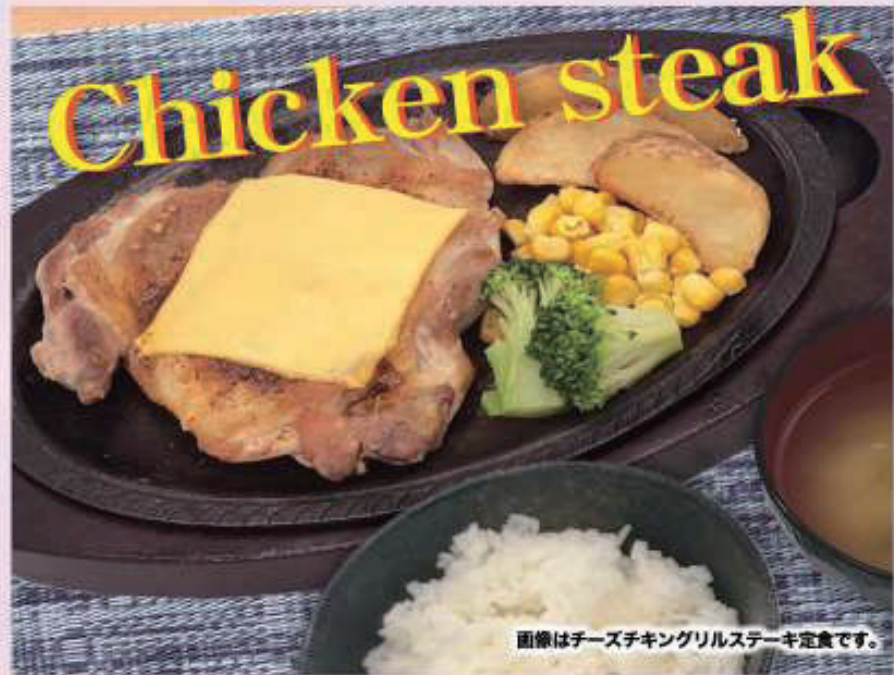
画像はチーズチキングリルステーキ定食です。