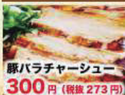
豚バラチャーシュー 300円 (税抜 273円)