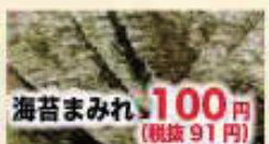
海苔まみれ 100円 (税抜 91円)