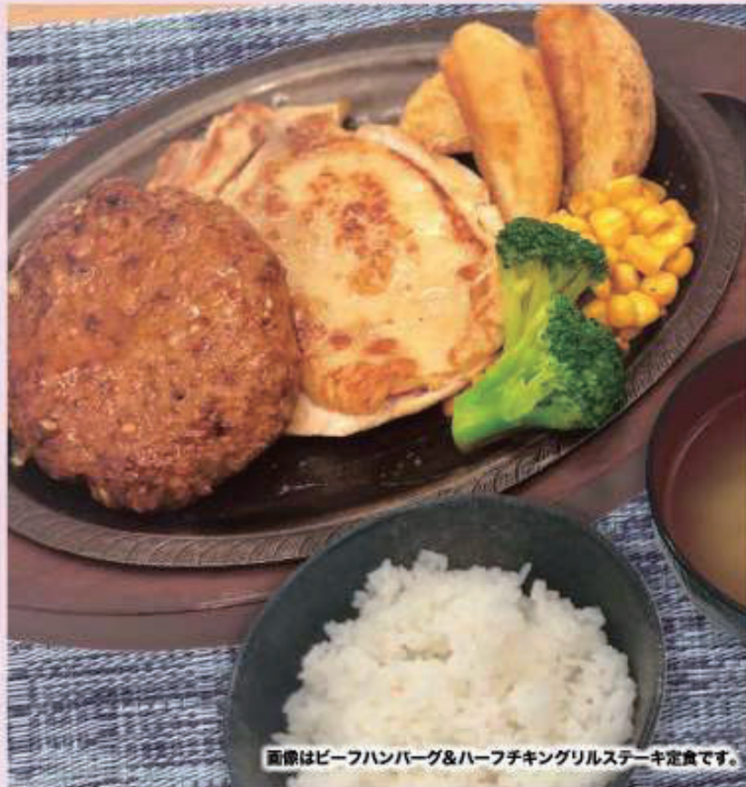
画像はビーフハンバーグ&ハーフチキングリルステーキ定食です。