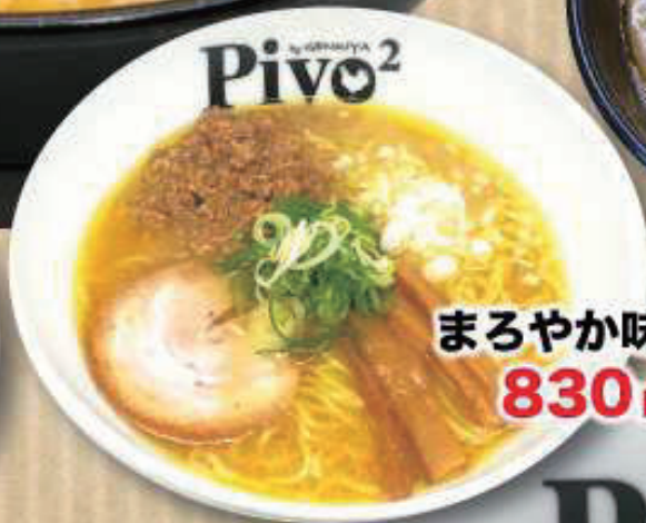
まるやか味噌らあめん 830円 (税抜 755円)