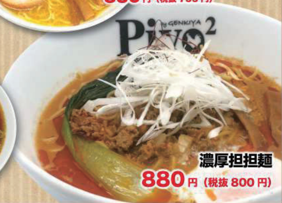
濃厚担担麺 880円 (税抜 800円)