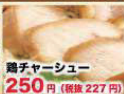
鶏チャーシュー 250円 (税抜 227円)