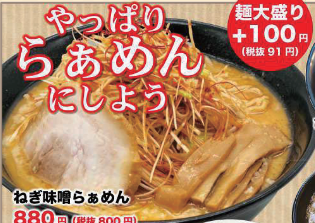
ねぎ味噌らあめん 880円 (税抜 800円)