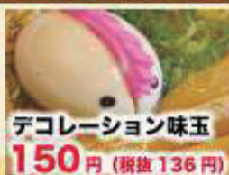
デコレーション味玉 150円 (税抜 136円)