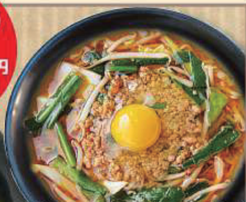
ぴよぴよ味噌らあめん 880円 (税抜 800円)