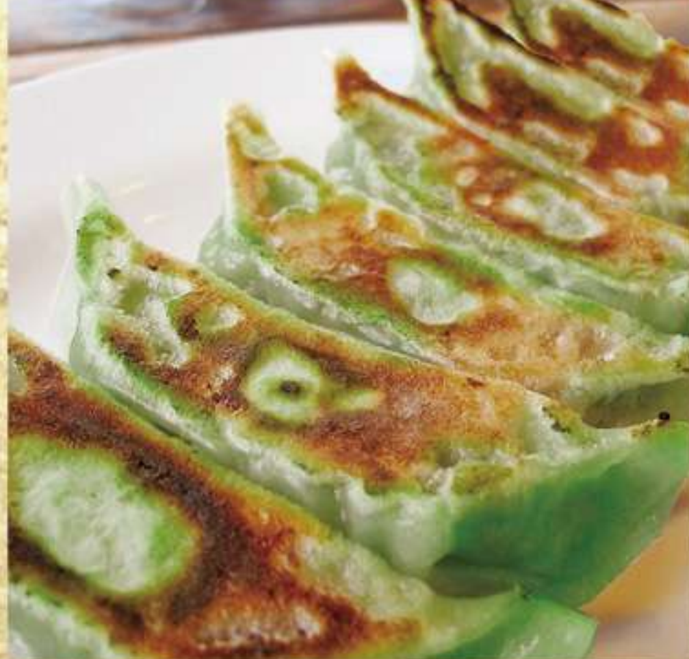
比内地鶏ぎょうざ