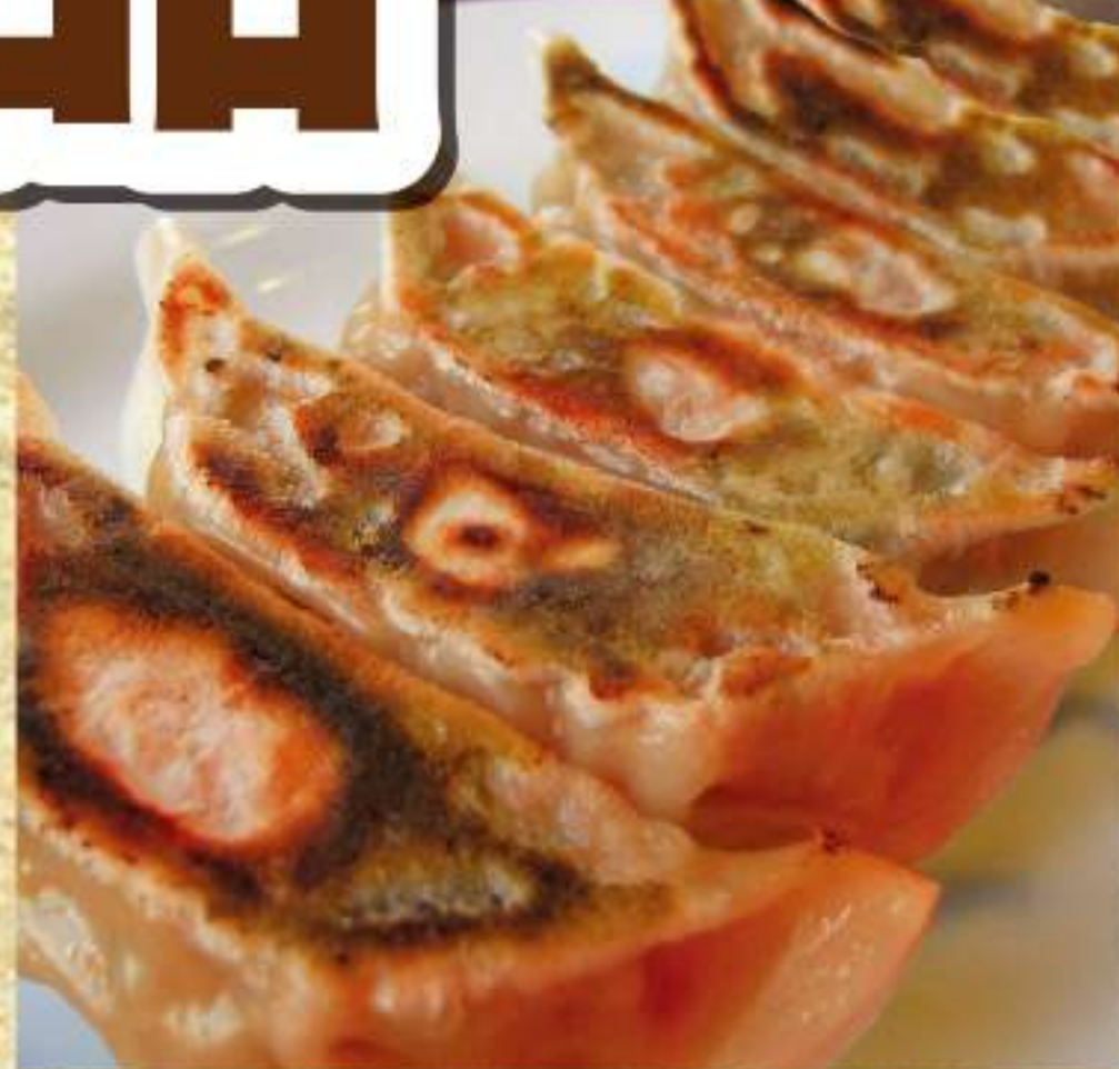
豚キムチぎょうざ