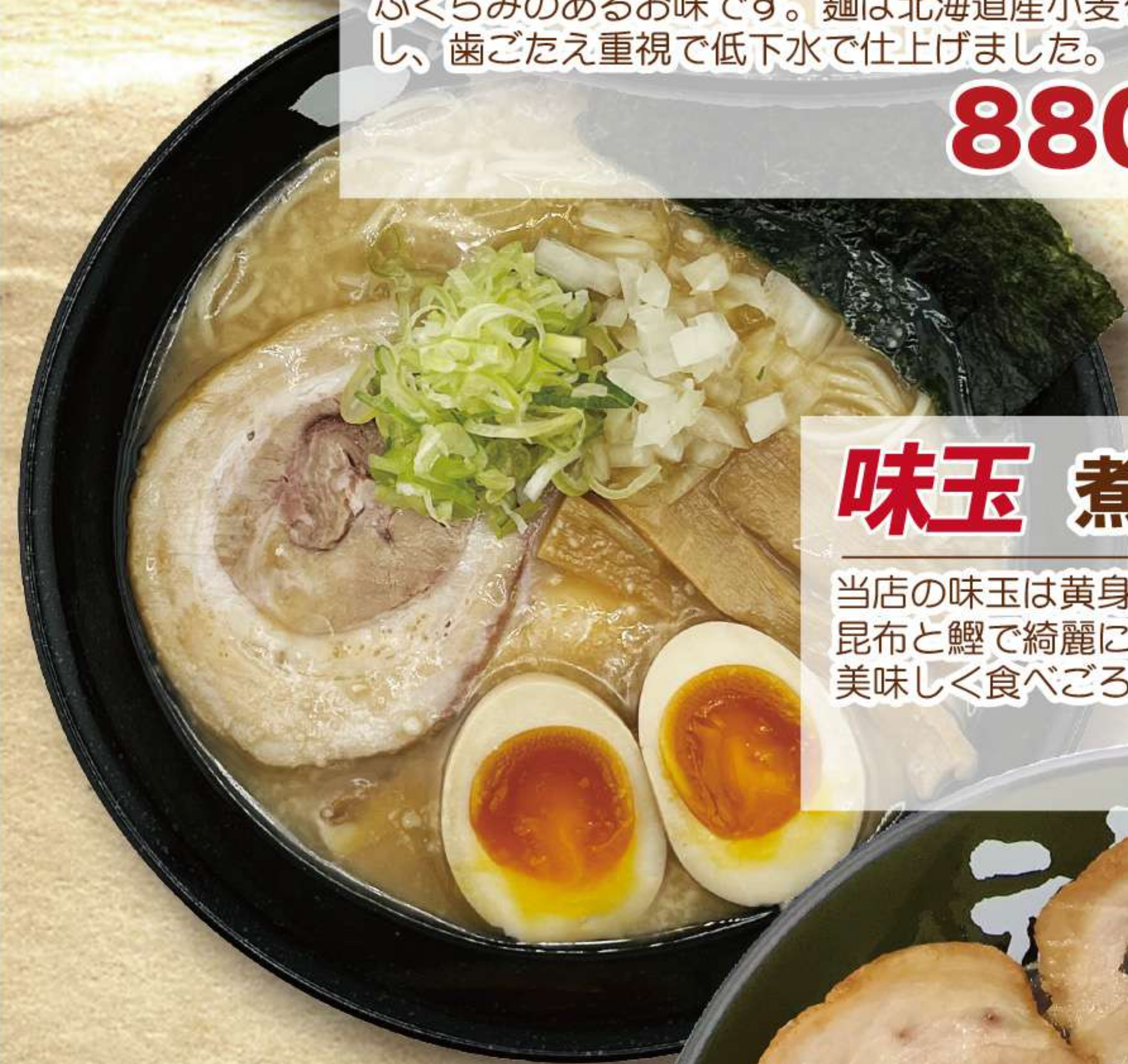
味玉 煮干し中華 しょうゆ味

当店の味玉は黄身がとろっとろけちゃう仕上がりに。昆布と鰹で綺麗にだしとりした醤油タレに漬け込み美味しく食べごろの味玉をどうぞ。