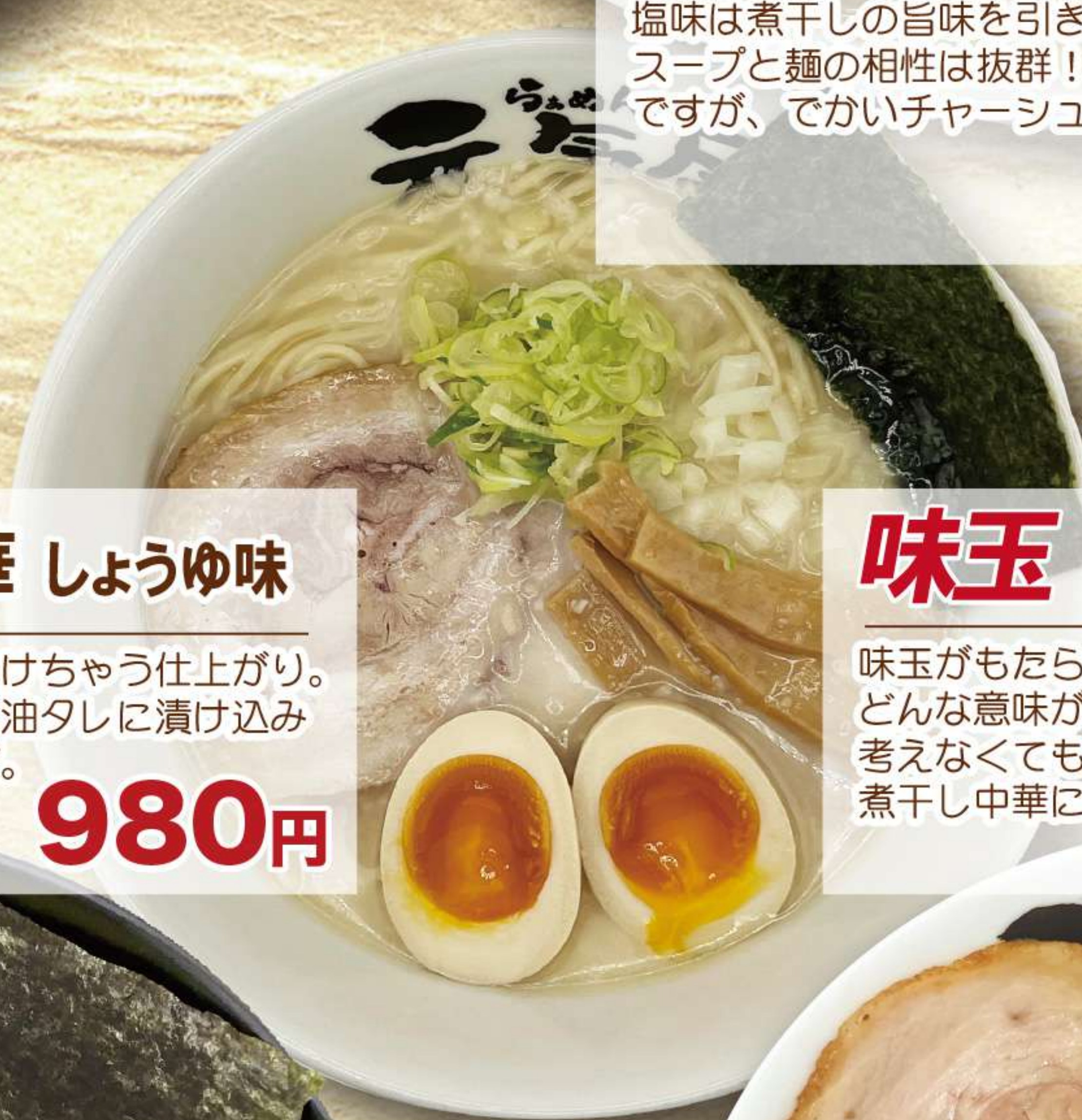
味玉 煮干し中華 しお味

味玉がもたらす喜びはこれからの人生にとってどんな意味があるのだろうか。そんなことを考えなくても味玉は存在し続けます。煮干し中華によりそいながら