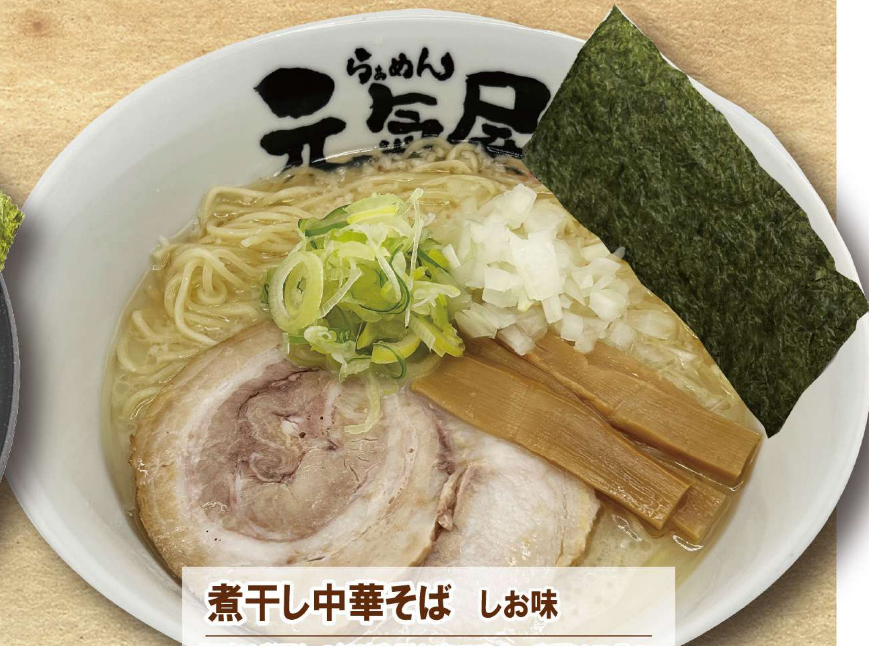
煮干し中華そば しお味

塩味は煮干しの旨味を引き立てます。奥深いコクのスープと麺の相性は抜群！ シンプルなトッピングですが、でかいチャーシューは魅力的！