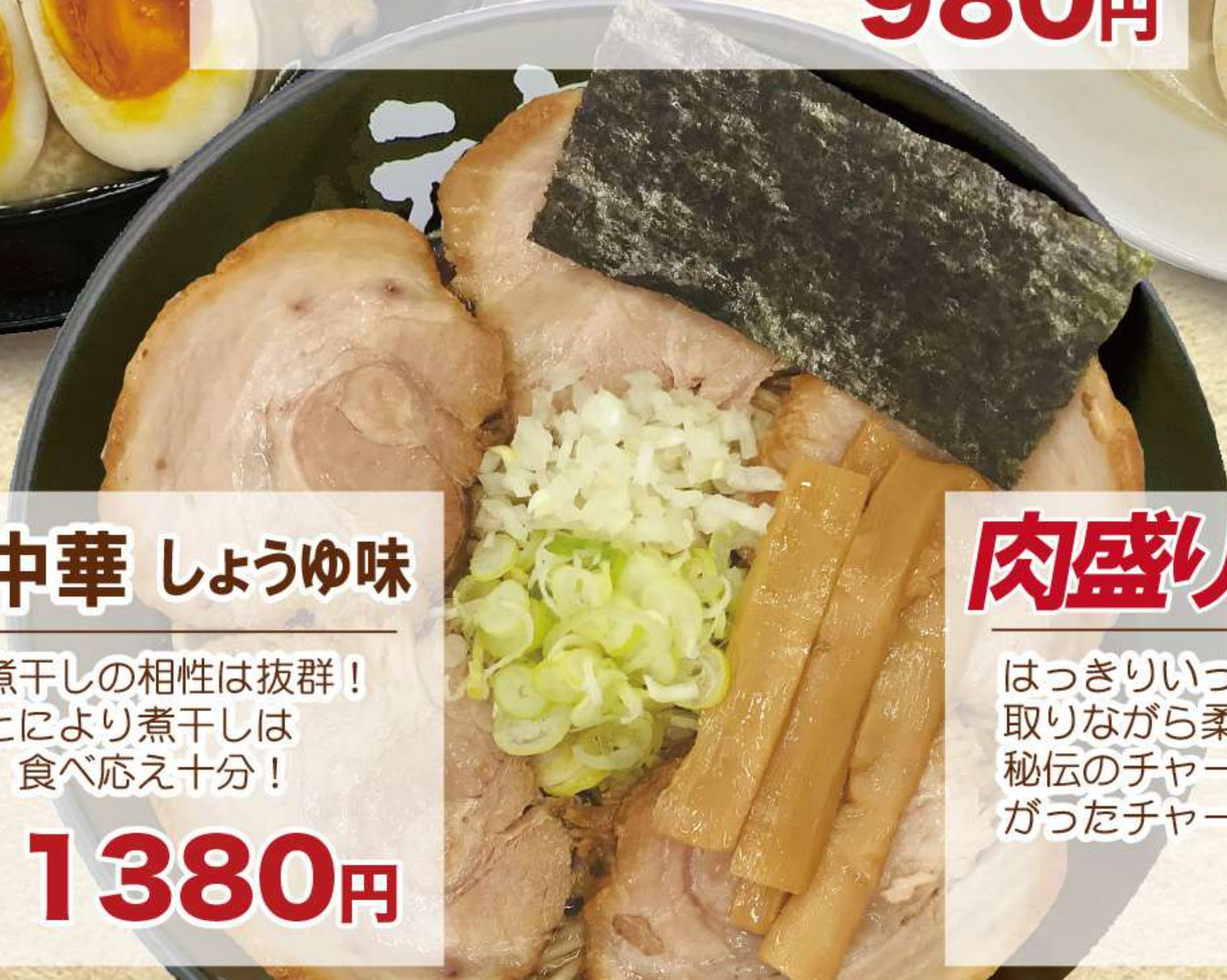
肉盛り 煮干し中華 しょうゆ味

とろけるチャーシューと、煮干しの相性は抜群！チャーシューが寄り添うことにより煮干しは高級食材へと進化しました。食べ応え十分！