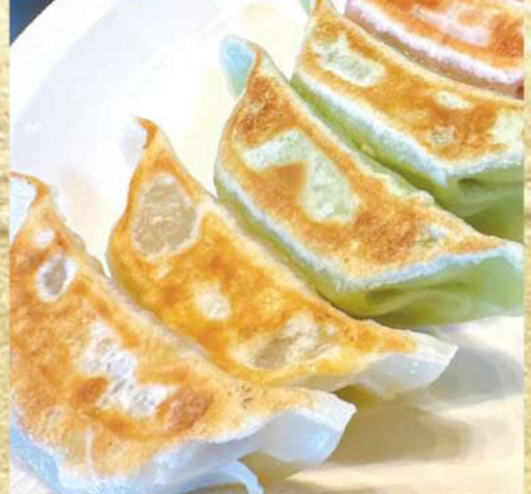
バラエティぎょうざ