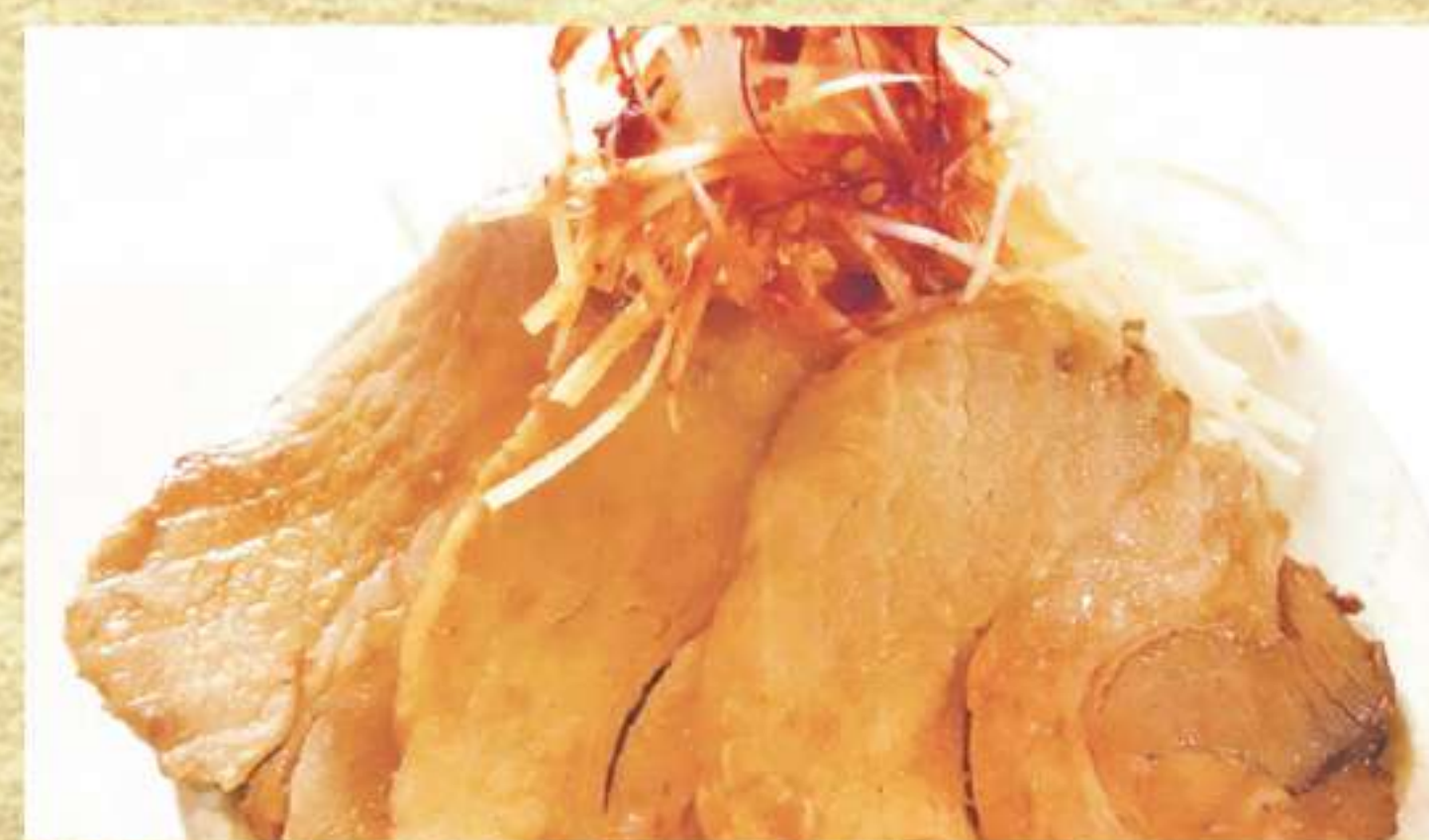
おつまみチャーシュー