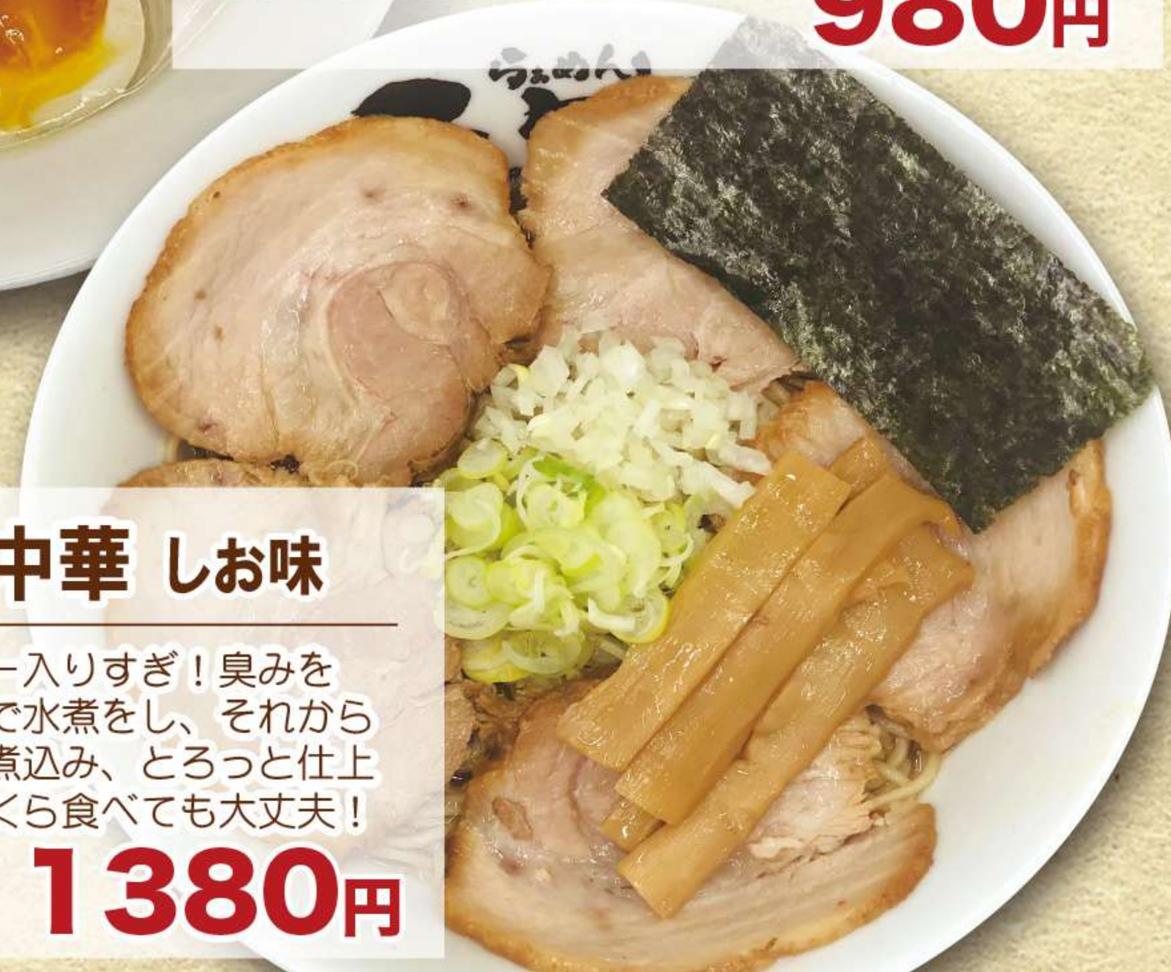
肉盛り 煮干し中華 しお味

はつきりってチャーシュー入りすぎ！臭みを取りながら柔らかくなるまで水煮をし、それから秘伝のチャーシュータレで煮込み、とろっと仕上がったチャーシューは、いくら食べても大丈夫！