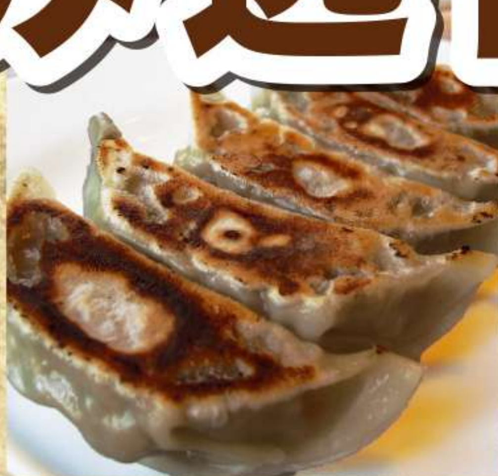
しらかみにんにくぎょうざ