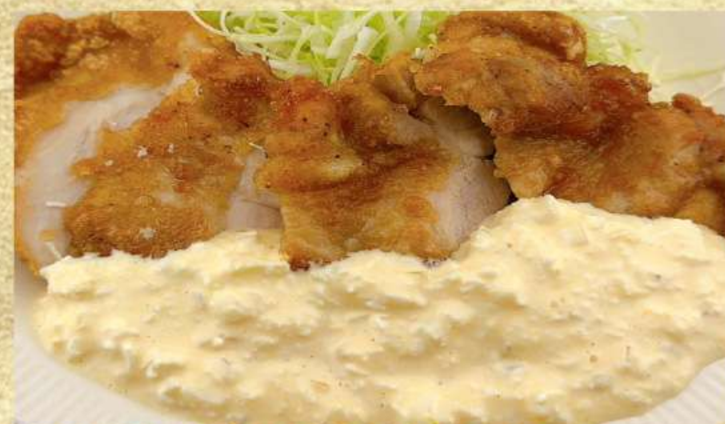
元氣から揚げタルタル