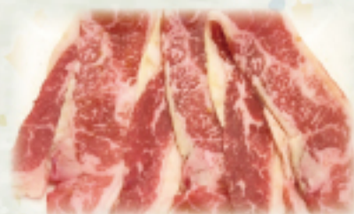
牛バラカルビランチ