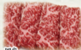
国産 黒毛和牛ランチ