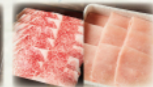
厳選和牛・豚ロースランチ