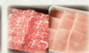
牛ロース・豚ロースランチ