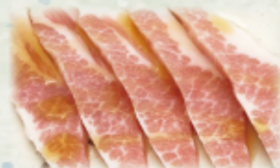
トントロカルビランチ