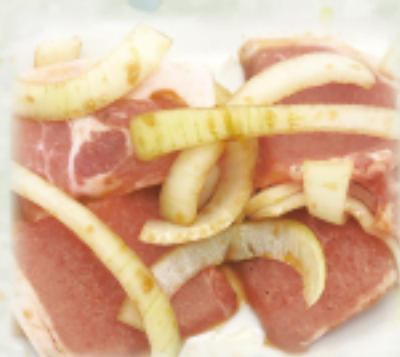
豚生姜焼きランチ