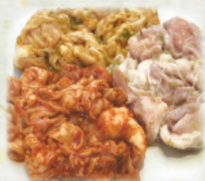
3色豚ホルモンランチ