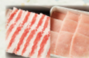
牛バラ・豚ロースランチ