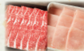
国産牛・豚ロースランチ