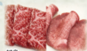
国産 黒毛和牛・牛タンランチ