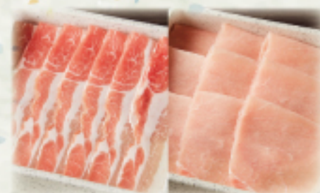
豚バラ・豚ロースランチ