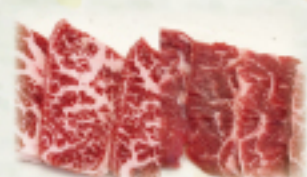
牛カルビ・牛ハラミランチ